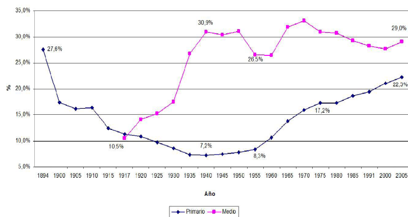
Cuadro 2: Porcentaje de la matrícula privada respecto del total (privada + estatal)

La relación entre destrucción de la educación pública y el desarrollo de la educación privada determina que no es posible defender a la escuela pública sin enfrentar la existencia de la educación privada. Defender la escuela pública hoy, significa levantar la bandera de Sistema Único Estatal de Educación, público, gratuito, laico y científico, ligada a la producción social. Es preciso expropiar a toda la educación privada e incorporarla al sistema único.