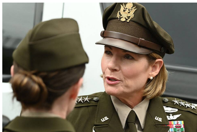
La jefa del comando sur de Estados Unidos, generala Laura Richardson.

Ese tratado da un control sobre la principal salida de alimentos que tienen Argentina, Paraguay y hasta Brasil. Siempre sospechado de enormes cargamentos de soja y cereales