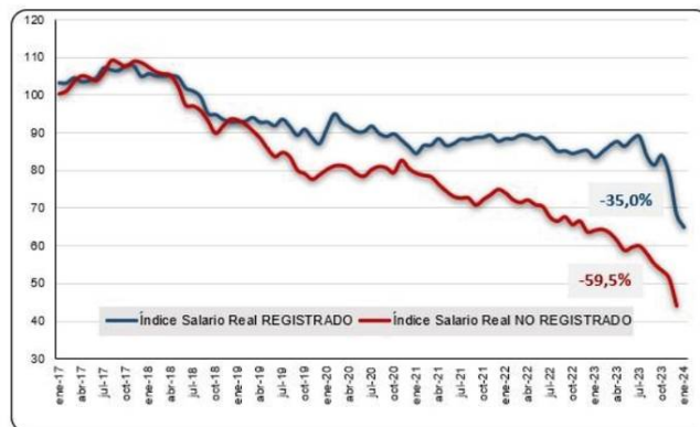
Caída del salario registrado y no registrado de 2017 a 2024. según GhidiniRodil.