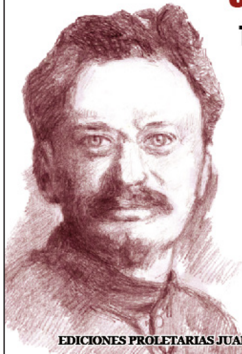
EDICIONES PROLETARIAS JUAN YAÑEZ

Trotsky y la Oposición de Izquierda advirtieron, y la historia confirmó, que esta política de la III Internacional conduciría a una dictadura fascista. Estudiando en profundidad el desarrollo de los acontecimientos, desarrolló una línea política revolucionaria, exigiendo la formación de los soviets, batallando por la salida de los comunistas del Gobierno del “Kuomintang de izquierda” en Wuhan y preparando las condiciones organizativas para nuevos auge de la Revolución.