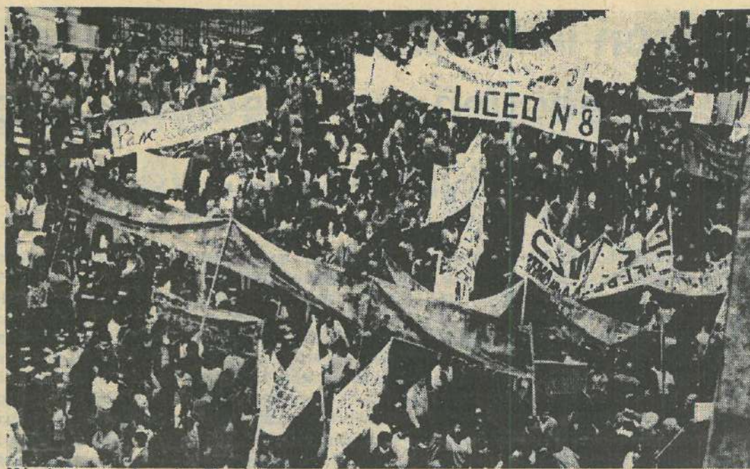
Más de una cuadra sobre Rivadavia ocuparon ayer los docentes y estudiantes.

El jueves 6 se cumplió el paro de 24 horas resuelto por la asamblea provincial y el martes 11 hay nueva asamblea. Destacamos el movimiento de base gestado en algunas zonas de Rosario (Empalme Graneros, oeste, Villa Gdor. Gálvez) en que los docentes autoconvocan junto a los padres para impedir la destrucción de la educación pública desde las bases.