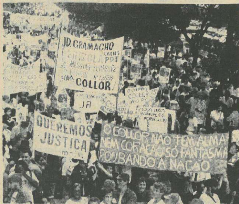
Los manifestantes llenaron las calles del centro de San Pablo con duras consignas

VIVA LA REVOLUCION POLITICA EN LA EX URSS! VIVA LA DICTADURA DEL PROLETARIADO! VIVA LA REVOLUCION SOCIALISTA MUNDIAL! —