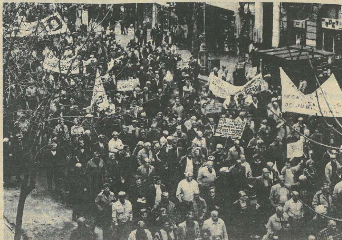
Tres cuadas de jubilados marcharon hacia el Congreso y Plaza de Mayo contra la política oficial.

Es necesario desenmascarar a este partido de la burguesía, impedir que recree ilusiones especialmente en la clase media con su aureola de democrático y honesto.